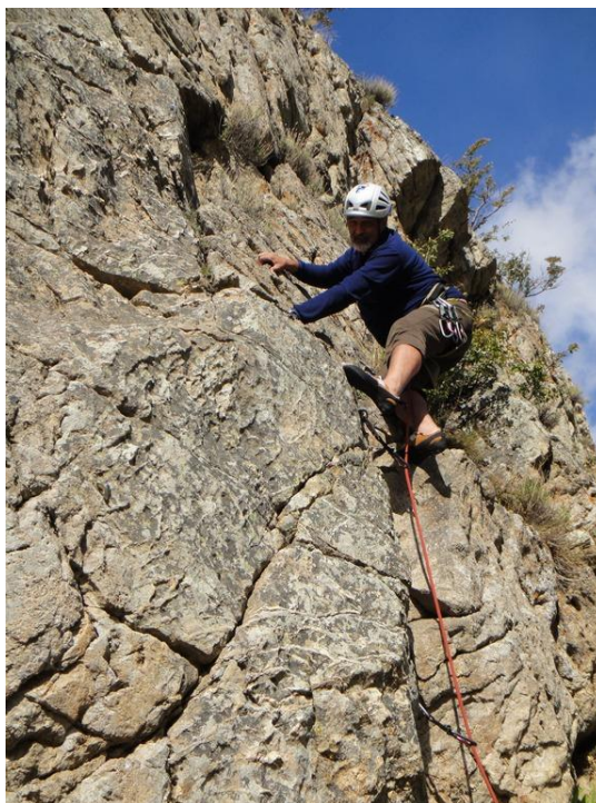
11) Dernière voie pour me finir...