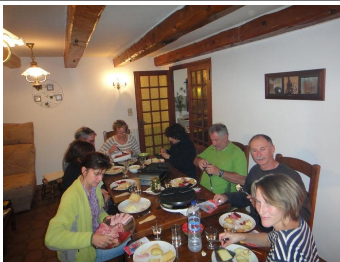
6) Une bonne raclette pour refaire le plein d'énergie...