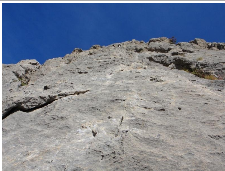
3) La 4ème longueur du « Faux cil » sur un magnifique caillou.

Je fais monter Dany puis une fois qu'elle est arrivée, nous nous changeons rapidement de chaussures, un soulagement pour les pieds après 180 mètres de grimpe. Nous mettons le K-way aussi car un petit vent frais balaye la crête. Nous attendons ensuite qu'Alain et