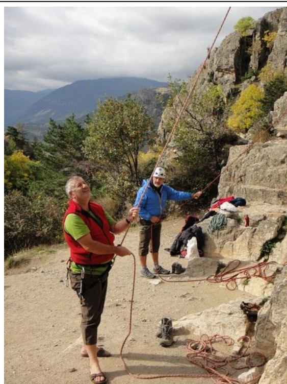
7) Les « Tuscan » assurent à Roche Baron...